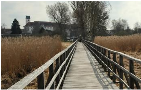
Federseesteg in Bad Buchau.