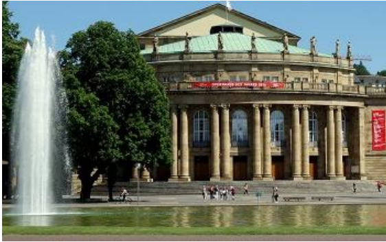
Oper Stuttgart.