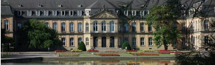
Ministerium für Finanzen.

Das politische Leben in Baden-Württemberg wird von aktuellen politischen Themen bestimmt. Zwar konnte Baden-Württemberg als eines der wirtschaftsstärksten Länder seinen Landshaushalt in den vergangenen Jahren weitestgehend ausgleichen. Auch sind die Arbeitslosenzahlen so niedrig, wie kaum sonst in einem deutschen Bundesland. Dennoch gibt es auch zahlreiche Baustellen in der Landespolitik.