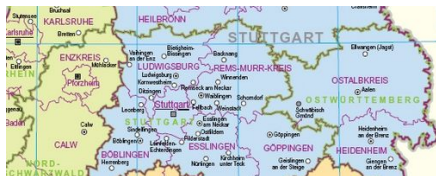
Karte: Landesvermessungsamt Baden-Württemberg

Gemeindeverbände (Landkreise) übernehmen Aufgaben, die zwischen den Gemeinden anfallen (z. B. Verbindungsstraßen, Öffentlicher Personennahverkehr) oder für die eine einzelne Gemeinde zu klein ist (z. B. Krankenhaus, Berufsschule, Sonderschulen, Müllabfuhr). Der Staat gibt immer mehr Aufgaben auch an die Landratsämter ab – besonders nach der Verwaltungsreform von 2005, indem in diese Schulämter, Forstämter usw. eingegliedert worden sind.