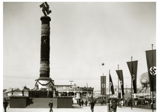
Cannstatter Wasen 1935 - Blick auf die Fruchtsäule und NS-Flaggen.

Im Gegensatz zum Reich waren 1933 die politischen Rahmenbedingungen in Baden und Württemberg klar. Zwar regierte Eugen Bolz in Württemberg seit 1932 ohne Parlamentsmehrheit, dennoch erwies sich seine Regierung, die badische ohnehin, als weitgehend handlungsfähig.