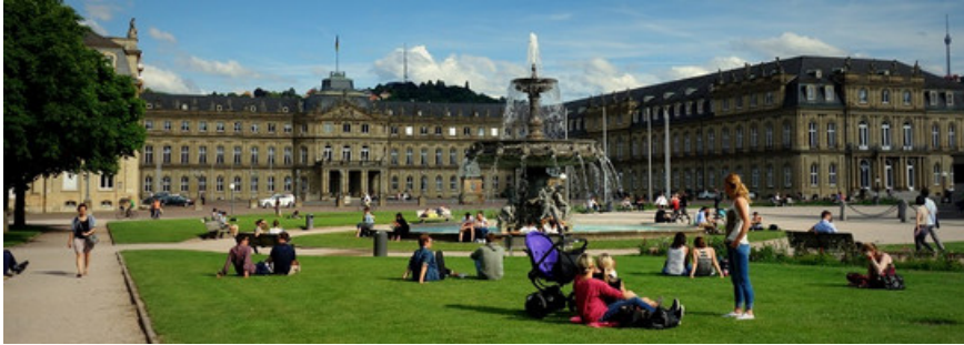
Schlossplatz Stuttgart.