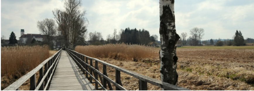
Federseesteg in Bad Buchau.

Um Tourismus auch in Zukunft wettbewerbsfähig zu halten, muss eine nachhaltige und umweltschonende Entwicklung stattfinden. Dabei gilt es, Nachhaltigkeit ökonomisch, ökologisch und sozial umzusetzen. Um entsprechende Fortschritte auszuzeichnen, wurde das Label "Nachhaltiges Reiseziel" entwickelt. Nach einem längeren Zertifizierungsprozess kann diese Auszeichnung Tourismusdestinationen dabei helfen, sich im internationalen Wettbewerb zu behaupten. Auch für die Verbraucher stellt das Label eine Orientierungshilfe dar.